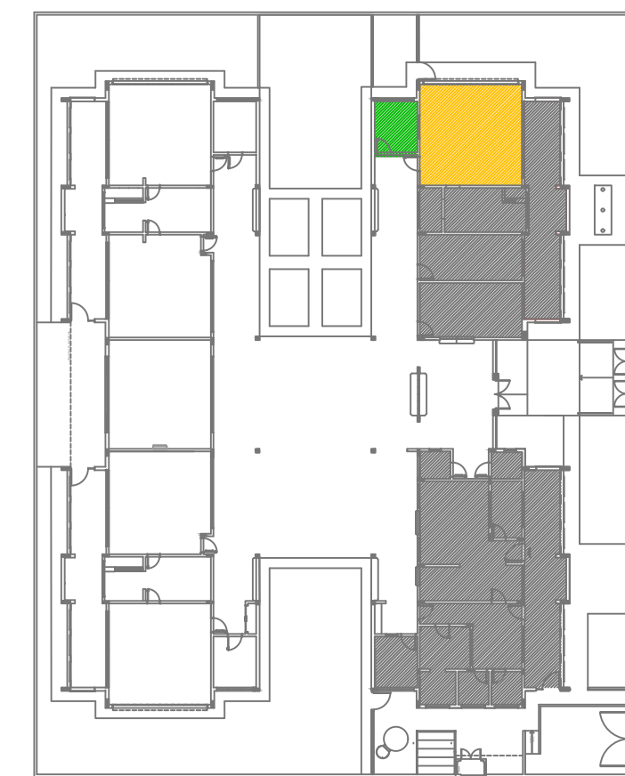
CROQUI DE REFERÊNCIA